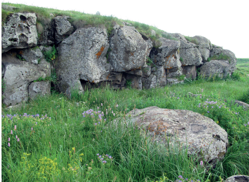
Крутая балка (она же Терпенская балка). 2015 г.

зрел на землях Богдановки, где, однако, такого названия нет. Мочаки около с. Спасское имели еще одно, видимо, сравнительно позднее название — «Бакши» или «Бахчи», где сажали морковь. В микропонимах этой группы вообще не употреблялись слова «покос», «пашня», «выпас».