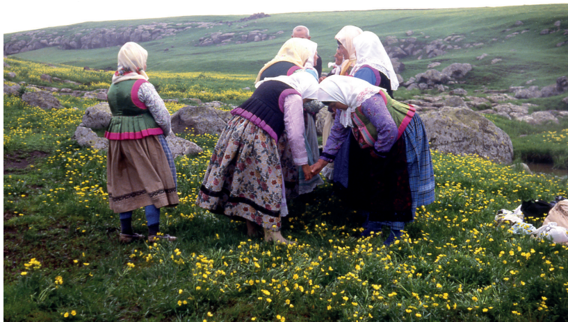
Богомление (поклонение) духоборцев Гореловки. Фото С.А. Иниковой. 1988 г.

Результатом крестьянского труда, праздников и богомолений под открытым небом на природе среди нареченных именами полей, балок, бугров, лугов стало тесное единение людей с землей, окружающей природой.