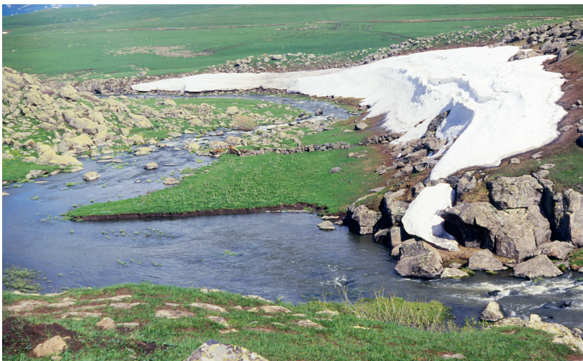
Вид около с. Гореловка. 1988 г.

На протяжении 150 лет проживания духоборцев в Джавахетии им приходилось ежегодно вручную выбирать камни из земли. Крупные камни с расчищенных полей шли на создание варков (загонов) для овец, изгородей в селениях, создавая неповторимый облик тех мест и селений. Через хозяйственную деятельность они преобразовывали среду обитания.