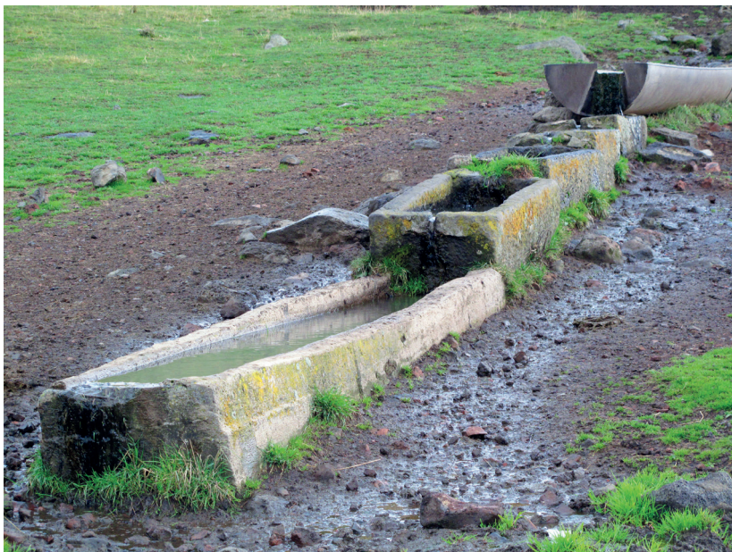
Корыты. Фото С.А. Иниковой. 2014 г.

на»; Маленькие и Большие озерушки . Название «Мочаки» встречается трижды: на землях Спасовки, Родионовки и Богдановки.