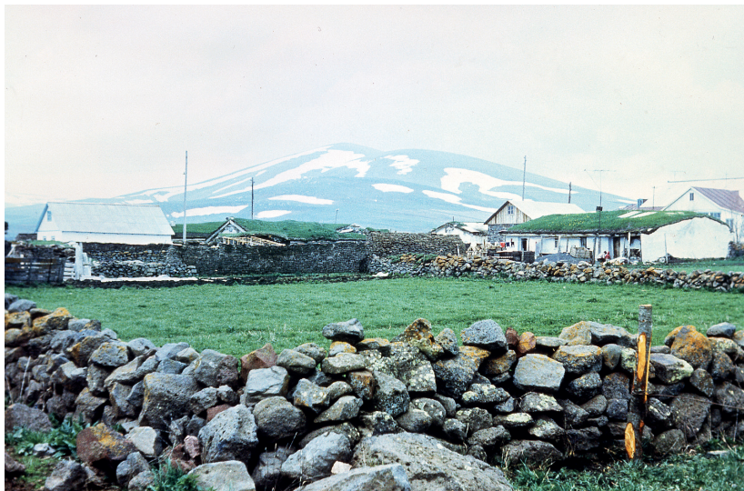
Тамбовка. Каменная ограда вокруг огорода. Фото С.А. Иниковой. 1988 г.

нами земли. Количество микротопонимов существенно зависело от качества рельефа (равнинный, гористый, горный). Когда часть духоборцев из Ахалкалакского уезда Тифлисской губернии (Богдановского района Грузии) в 1921–1924 гг. переселились в Сальский округ Донской области, где черноземные степи простирались до горизонта, у них отсутствовали природно-географические объекты для выделения их микротопонимами. Возможно, какое-то небольшое количество их и появилось в те годы, но в конце 1980-х годов никто из людей старшего поколения, помнивших единоличную жизнь, не смогли вспомнить микротопонимы. При колхозах существовала нумерация участков земли, составленная землемерами. Влияние на количество топонимов у закавказских духоборцев оказал и тип хозяйства. Безусловно, даже в условиях сложного рельефа при занятиях только скотоводством освоение пространства не требовало бы столь большого количества обозначений.